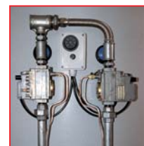
Два электрических клапана позволяют использовать на половину мощности